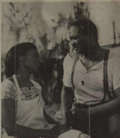
Willard White e Cynthia Haymon: Porgy and Bess .